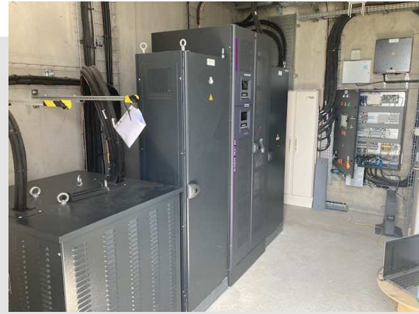
Microgrid usine Guyenne (33)