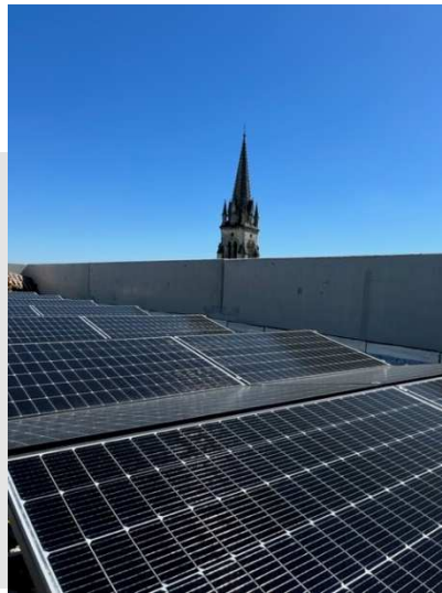
Photovoltaïque hôtel police Mérignac (33)