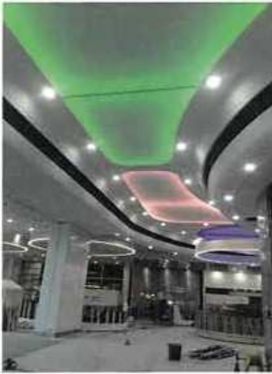
Eclairage centre commercial Ametzondo (64)