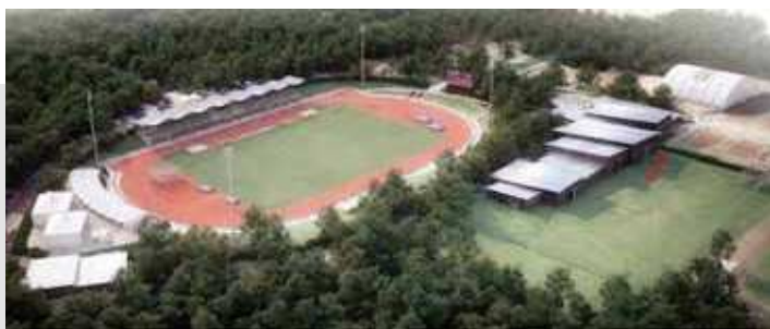
Stade Paul Bernard à Talence (33)