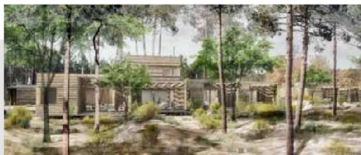
Center Parcs (cottages) des Landes de Gascogne (47)