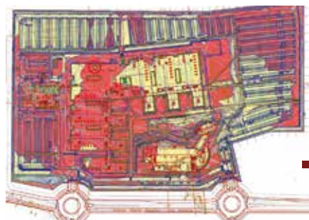
■ Plan de terrassement déblais / remblais