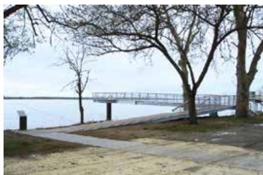
■ Ponton roque de Thau, (33)