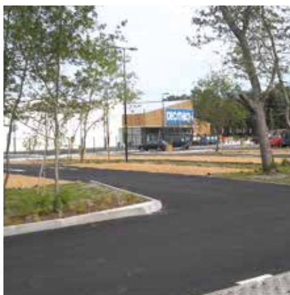
Decathlon - La Teste (33) ■

■ 10 km réseau de chaleur urbain classés à Bordeaux (33)