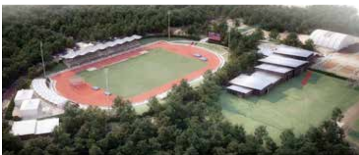
■ Stade Paul Bernard