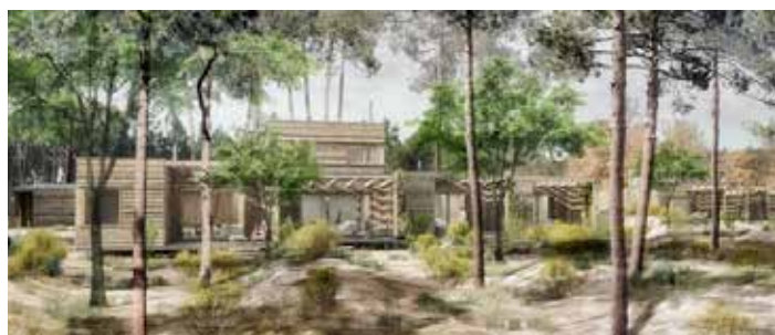
■ Center Parcs (cottages)